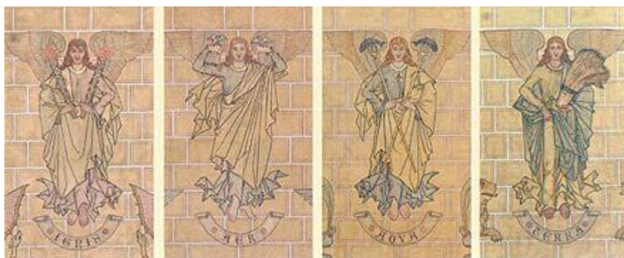
Die vier Elemente Darstellung von August Essenwein (1890)